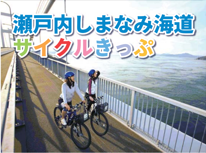
因島大橋 多々羅大橋 生口橋 来島海峡大橋