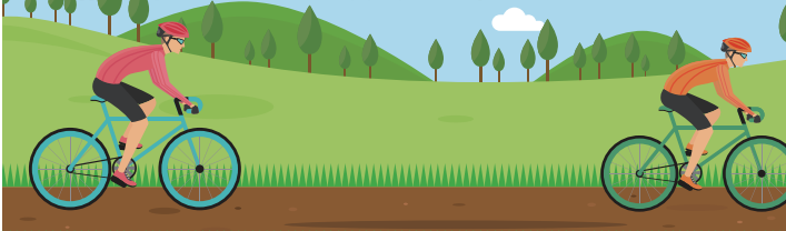
世羅幸水農園 香山ラベンダーの丘 花の駅せら フラワーパークせらふじ園