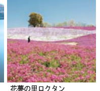
花夢の里ロクタン

※早朝に出発する便にご乗車される際は、窓口が開いておりませんので、前日までにご購入ください。※当セット券の転売は禁止とします。 ※クレジットカードでのお支払いはできません。