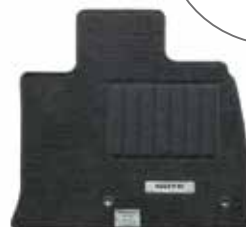
フロアカーペット (スタンダード)