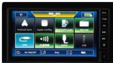
9インチ ディスプレイオーディオ