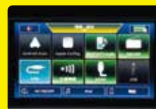
9 インチ ディスプレイオーディオ