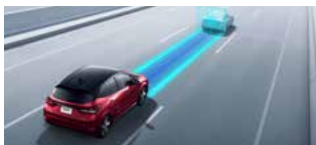
プロパイロット(ナビリンク機能付)