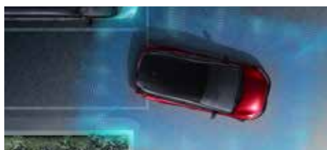
インテリジェント アラウンドビューモニター