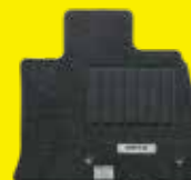
フロアカーペット (スタンダード)

Photo: X, フリアントシルバー(M). *フリアントシルバーは標準色です。