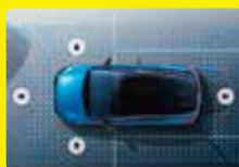
インテリジェント アラウンドビューモニター