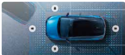
インテリジェントアラウンドビューモニター