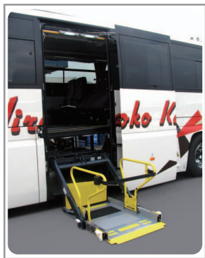
■中央スイングドアからの昇降

ガーラならではの優雅な空間で、車いすのお客様にも ゆったりとした旅を楽しんでいただけます。