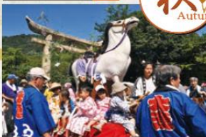
子どもの誕生と健やかな成長を願って街中で八朔の馬(台車にのせた馬の模型)を引き回します。