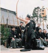
新年の平穏を祈る祝慶が変化した行事。福山市無形民俗文化財に指定されています。